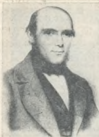
А. Андерсен (1818—1879).

Весною 1851 года в английской столице шли последние приготовления к открытию Всемирной выставки. Одновременно должен был состояться шахматный турнир. Его инициаторами выступили лидер английских мастеров Говард Стаунтон и Сент-Джорджский шахматный клуб. Это был первый в истории шахмат подлинно представительный турнир международного масштаба. Проводился он не по современной круговой системе, при которой все участники встречаются между собой, а по кубковой. 16 мастеров — английских и зарубежных, — разбитые жребием на пары, играли небольшие матчи. После первого этапа потерпевшие поражение выбывали из дальнейшей борьбы — совсем как в состязаниях гладнаторов или в нынешних матчах претендентов.